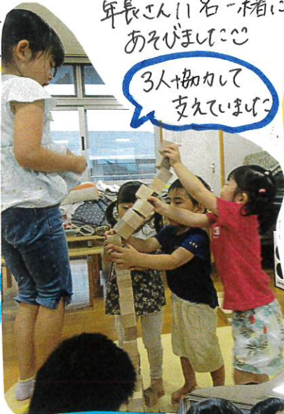
年長さん11名一緒にあそびました