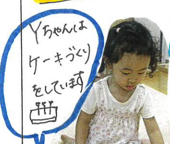
Yちゃん(ケーキ作り)をしい時