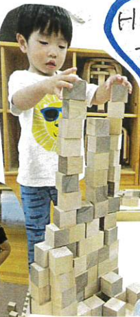
Hくんは一生懸命ロボットを作っていました!! つよいびな