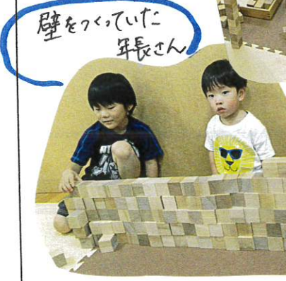
壁をつくっていた年長さん