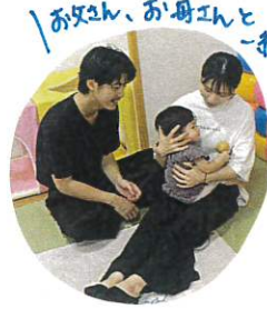
お父さん、お母さんと一緒に♡