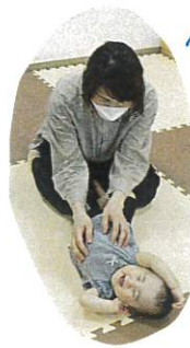
体をさすってもらい気持ちいいね♡