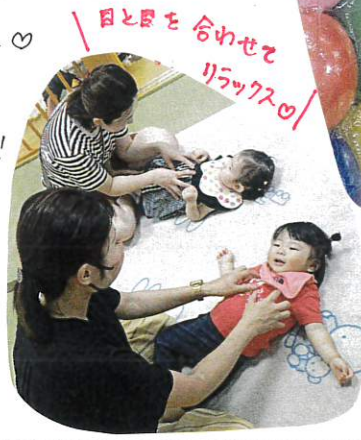
目と目を合わせてリラックス♡