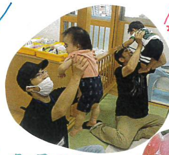
お父さんとのふれあいを楽しんでほしい♡