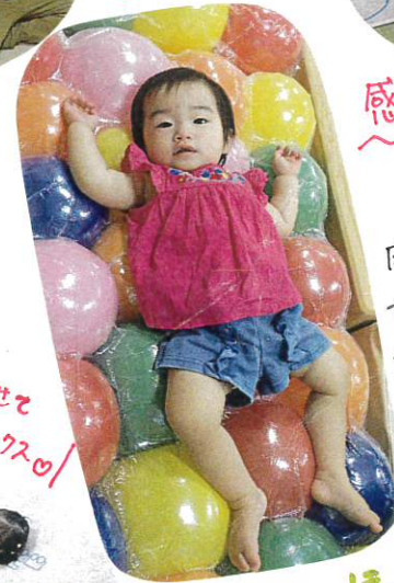
感覚遊びも楽しませたい!!