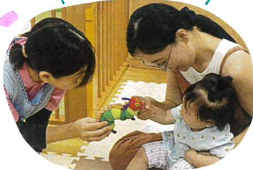
お母さんと一緒にタッチ♡

たくさん保護者の方に、参加していただき、ありがとうございました!! いつもとけし違う雰囲気の中でも、子ども達は笑顔でリラックスした様子でした♡