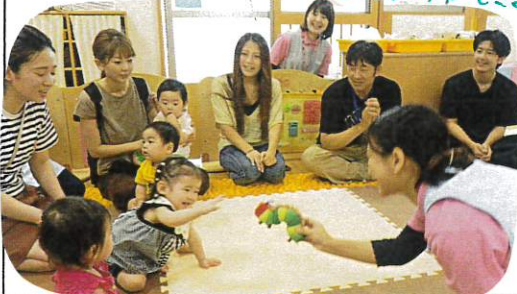
みんなに真似させて上手にタッチができました♡