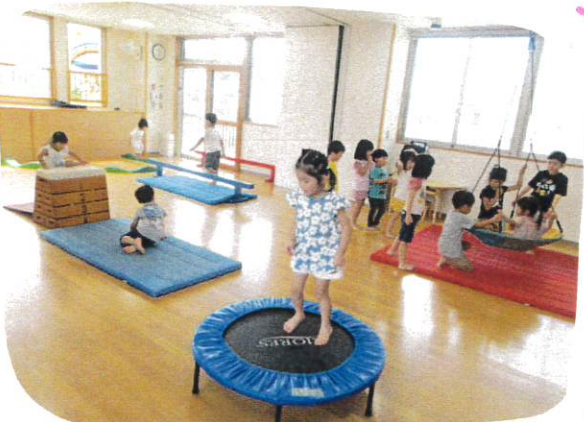
休み中に育てたピーマンとトマトの収穫も(しました)

幼児クラスの子にカオス - 2歳児ゆり組の2人も糸者にホールで運動あそびをしました! トランポリン、ブランコ、跳び箱、平均台... それぞれのコーナーで思いっきり身体を動かして楽しみました♡