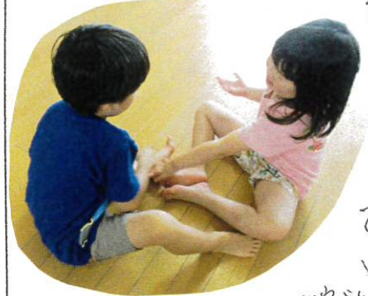
よおとのおしりさ

はら組とさくら組 と一介者にふれあい あそびをします。 さくら組さん= 1ドにもらい ながらふれあい あそびを楽しんで います。 お家と一緒にあそび して下さいね!