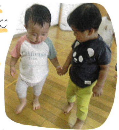
手を伸ばしてお返事をするといい!!