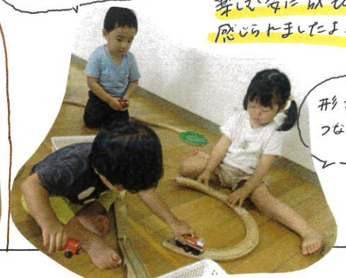
形を合わせて つなげていた Kさん