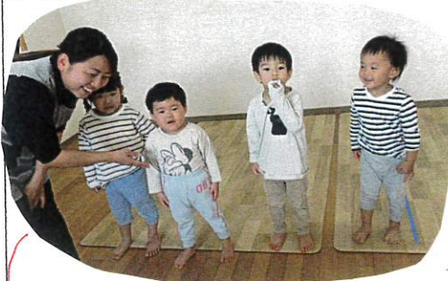
"あさのかいをはじめます"

今日から4人ずつ当番活動を始めました!! みんなの前に出るのもドキドキしながら自分の名前を言ったり、朝の会の進行をスムーズに