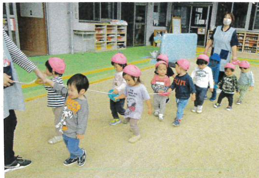
お散歩ロープを持って(園庭をぐるぐる歩きまわした。とろとろ(園外散歩)も行けるかな?