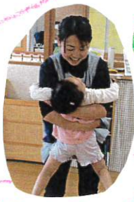
今日のチャンピオン