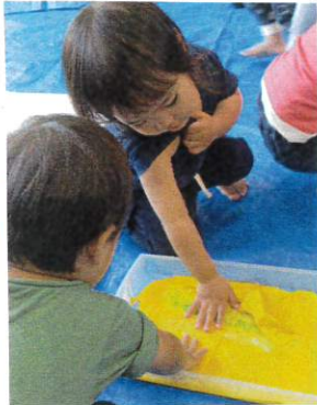
紙の真ん中まで入って 全身で楽しみました。