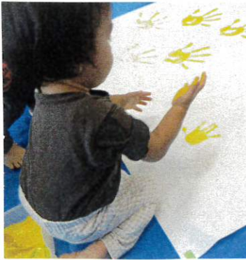
べったんと手型をつけた後、自分の手と見比べていました。