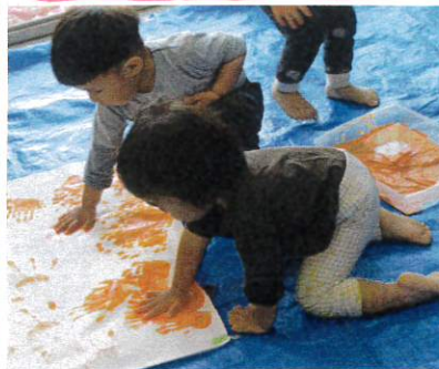
「用紙まくりしてやりね」と伝えると絵の具を舐める際にも服を指して手に付けていましたよ。