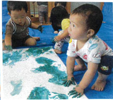
何度もポタポタして、いぼいぼの手型をつけています。つかなくなるまで絵の具をつけていました。