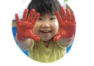
汚れてよい服装の準備、おリパとうごせました。