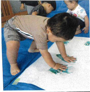
少しでも遠くに手型をつけようとお尻を浮かせて、まま両手をつけています。