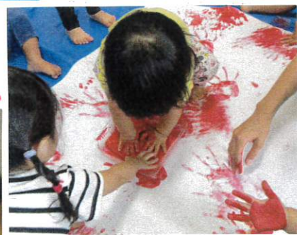
絵の具を手のひらで舐めるのが嫌な子は指先で楽しみました。少しずつ慣れるよう舐めました。