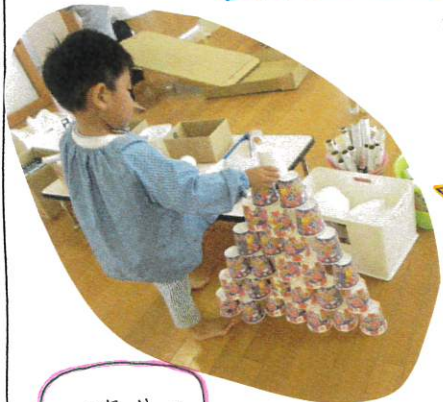
カップタワー (はじめの時は、下の列が4つから始まったのに今は、7つ!!!)