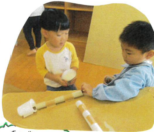
車雲がしコーナー (トングリの落ちる所にカップを置いて受け止めています)