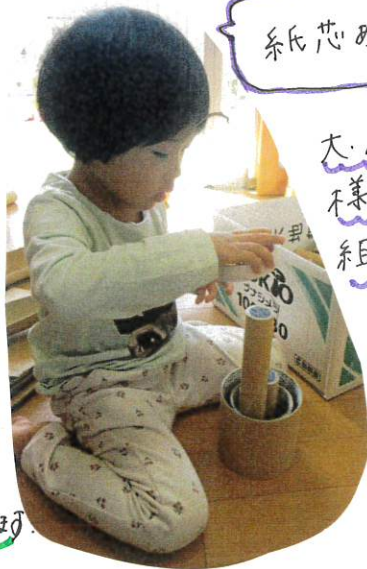
紙のあそび (大・小・長・短・異なるサイズの紙を組み合わせています)