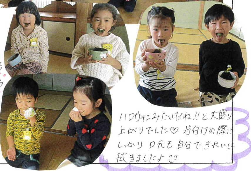
110ウにみにいただね!! と大盛り上がりで、しに♡ 片付けの際は、しっかり口元を自分できれいに拭きましたよ。♡

普段よりも、はるかに多いお抹茶を入れ、お茶を点てる先生の様子に、期待感を持ちながら、一人ひとりが順番に頂きました。「にかむいさ」「おいしい!!」感想はそれぞれで、かむいさ、とても良い体験となりました。