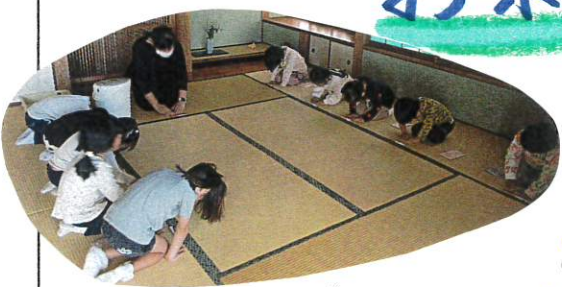
初めの終わりの礼を丁寧にしています。

先月に予告があったとおり、今日は「ドドドのみ茶」に挑戦しました。普段よりも少し、ドドド、ソワソワしながらも、お茶の会が始まると、1つ1つの動作や、お作法を丁寧に作っていました。