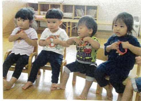
鳴らさない時は胸にきゅんと当てて音を止めることを伝えましたよ!

保育教諭の重みを見ながら手首をたたくて鳴らしたり、頭の上にあげてキラキラと鳴らしたり、リズムに合わせて楽しみました。