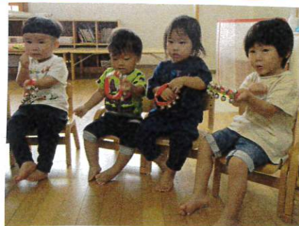
まだ楽器を使い始めたばかりなので、丁寧に使うこと、楽器でたたかないこと等、丁寧に伝えていきました。