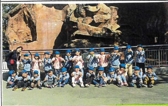
サル山の前で写真もとりました出発です!!

爬虫虫類食館の中では、 夜行性の動物に 興味津々でした。 夜に活動な 動物たちにも 会えて、嬉しそう でした。