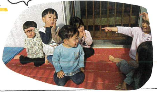
にらめっこおてい