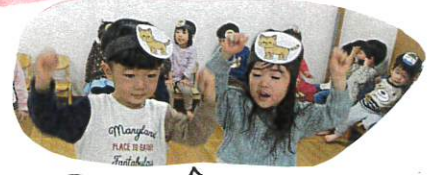
ネコになりきって重かいています♡

劇遊びの中で「おばあちゃんってどなたかな?」「ねこはニャーン」と友だちや保育教諭と話しながら楽しんでいます♪