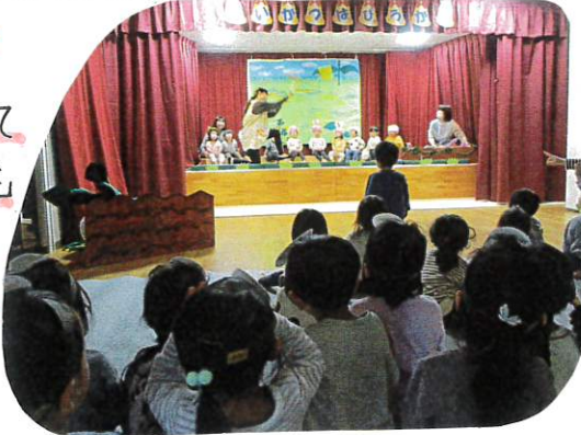
他のクラスの劇遊びも見せてもらい興味津々でした。