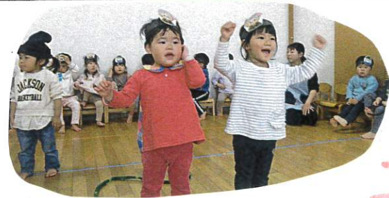
台詞やポーズも自信满满♡

主な活動 9:20 朝の会 9:30 コーナー遊び 9:50 劇遊び 10:20 水分補給 10:30 楽器遊び 11:00 片付け 11:15 給食