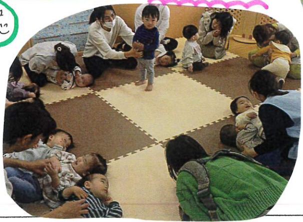
ふれあいのあそび♡