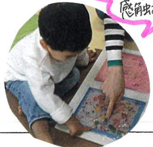
センサーバッグの感角虫あそび!