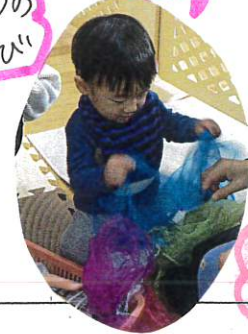
シフォン布あそび!