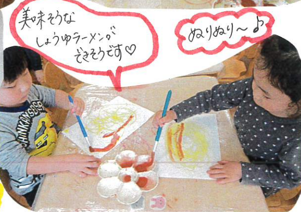
美味そうなしょうゆラーメンができて可愛!