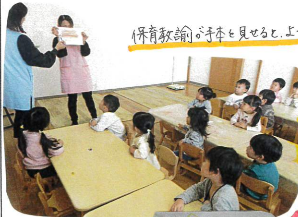
保育教諭が手本を見せると、よく見ての子達!

ラーメンに入れる具材を知り知り切っています。グループで保育教諭が見守り、援助してあげる環境の元、真剣に行う姿が見られています。