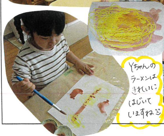
Yちゃんのラーメンはきれいに書いていますね!