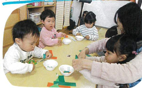
自然と背伸びも伸びる子達!