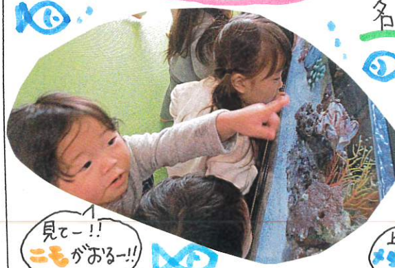
見てー!! ニモがあるー!!

大きな声を出したり、水そうをたたいたりしない。お約束を守って魚を見ることができました。