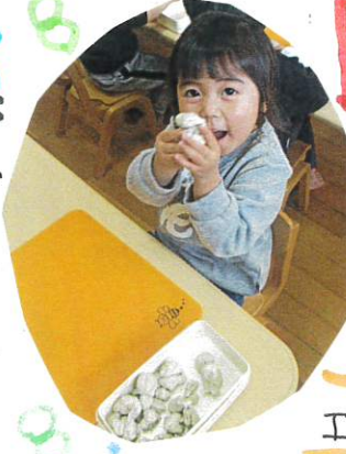
雪だるま 作ったよ!!