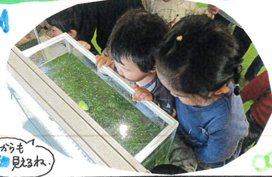
上からも ニモが見えるね。