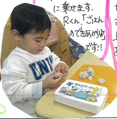
小さい小さい粘土 を集めてお皿の上 に乗せます。 Rくん「じゅん めてきあがり です!!

粘土のふたを 使って粘土板を 坂道に... 丸めた粘土を 上から転がして あそんでいます。 「見てー!!」 転がる 粘土を 楽しんでました。