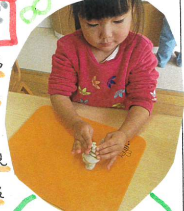
形が崩れると、もう度 しっかりと固めて作り直 します。

ちぎったり、丸めたり、指先や手のひらをしっかり使って遊べるようになりました。また、遊び方も自分で考え工夫して遊ぶ姿が見られるようになりました!!