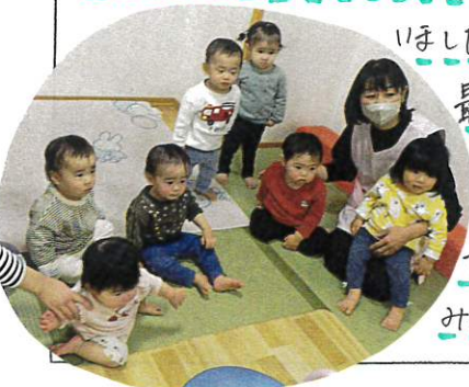
最初は1人ずつ順番にあがってました!!