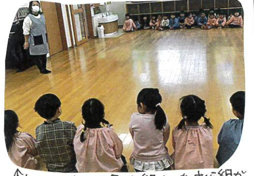
↑おそびはすばらしい「ばら組さん」をさくら組がリードして話し合っていました

ふれあのおそびに行こうとホールにいくとばら組さんか... 手と手を取って、たくさん歌や曲のいい曲に合わせて、目と目を合わせて、相手の事を考えながら体を動かしました。