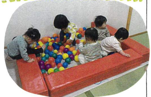
ボールプールの中に入って足をバタバタしたり、両手でつかんだり楽しんでました!!