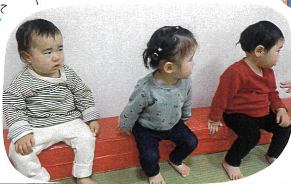
はやくすバリたい気持ちとぐとこらえて順番を待っていました