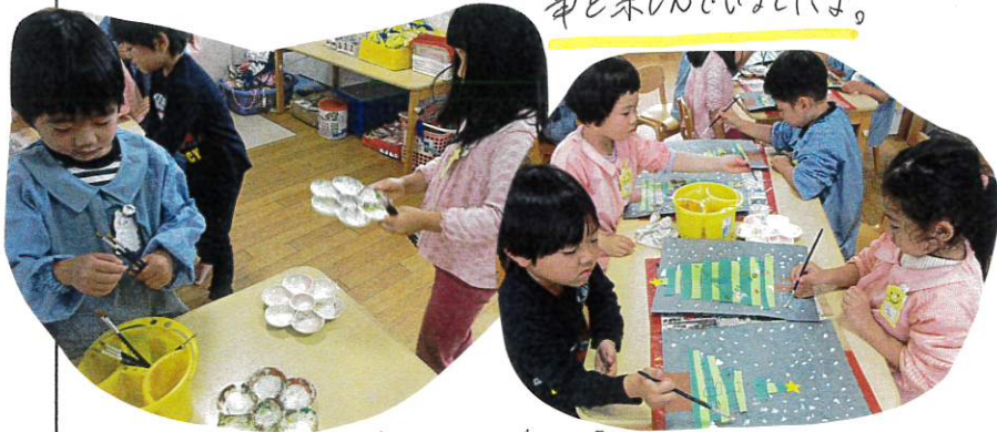
道具の準備は各机ごと自分達で 役割を決め行います。