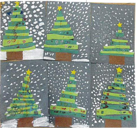
益々クリスマスが 楽しみになりました♡

来週のつきと行いました。 ①クレヨンでツリーの飾りと描く。 ②絵の具で雪を描く。 事務所前のツリーにあつた飾りと 思い出しながら描いたり、「大雪降らせたい」 等と、自分なりにイメージした事を表現する 事を楽しんでいましたよ。