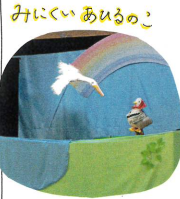
みいくい あひるのこ