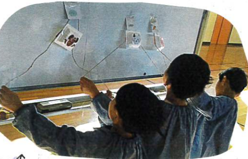
↑ 動物たちにエサをあげよう