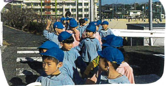
はじめてのことだ