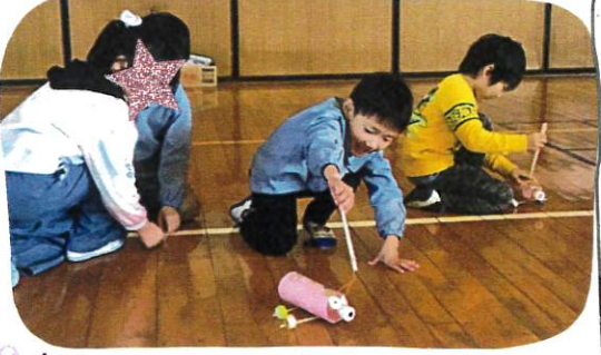
↑ 動物たちと一緒に散歩しよう