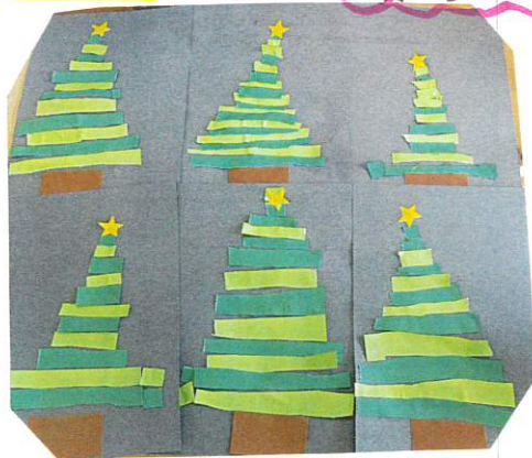
ツツきはまた来週♡