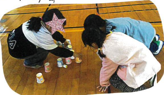
↑ ノンギン、ホーリング