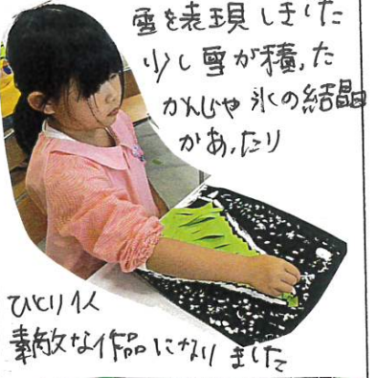
ツリーに素敵な作品に作りました

昨日作ったオリジナルツリーに自分の思いを絵に表現しながら、綿棒を使って雪を表現しました。少し雪が積ったかんじや氷の結晶があたり