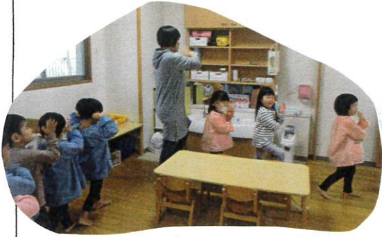
英語の歌も覚えてノリノリで歌っていまよ♪