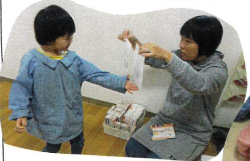
ベルとリースの2つの中から好きな方を選びました。

折り紙の向きや形をよく見て頭の中で工程を整理して折っています。折っていると思いがけず違う形ができてくることもありましたが、この形はちがうぞ、折り方を覚えてみようよ、やり直し 学んでいっています♡