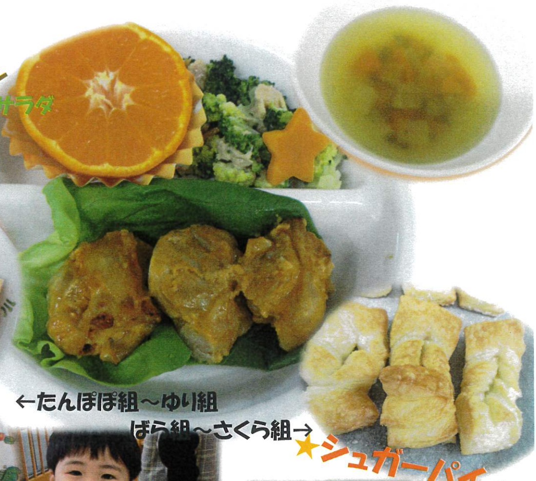
←たんぽぽ組～ゆい組 ばら組～さくら組→