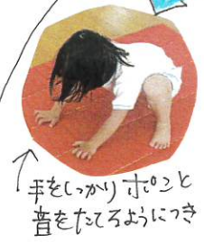
↑手をしかり、のここと音をたてるようにつき