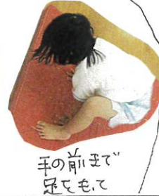
手の前まで足をもていきま