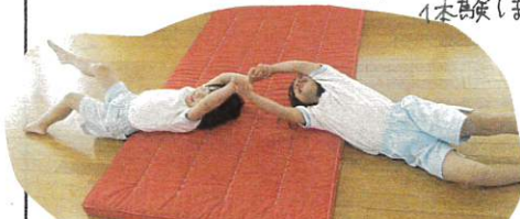
↑友だちとノーズを合わせながら 取り組みます

今日はマット1枚で季節を思いながら、イメージをもて製作を飛ばし、体のどこの部分を、使いかを意識しながら、様々な動きを1本練習します。