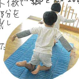
↑しかり手を広げ、つま先をたててひざで前進