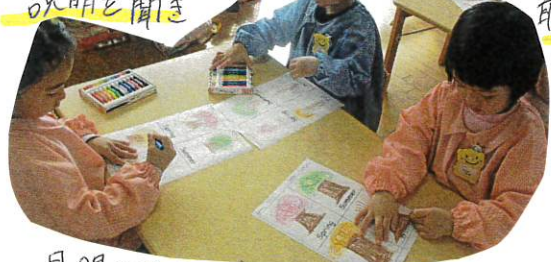
見聞きする力の育ちが感じられました。