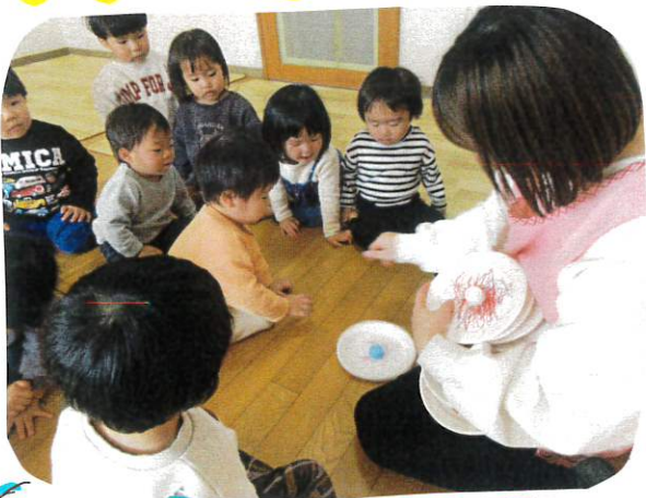
昨日作ったコマで遊び、