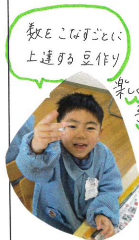
数Eこねるとい 上達する豆作り