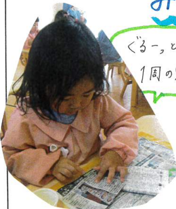
くーっと 1周のり付け

のりの使い方、紙が大きい時、小さい時ど こにのりをつけるか使い分けることが できています。