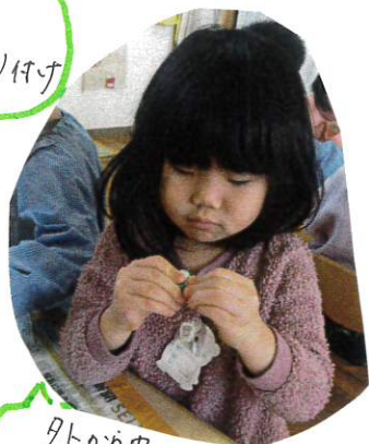
外から中 外から中...