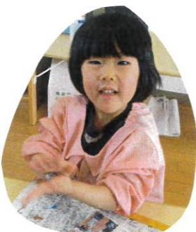
お団子のように 手の平でこねこねすると きれいな丸になること発見!!