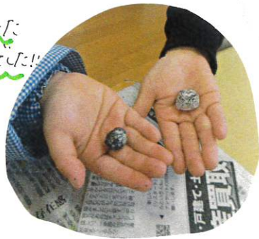
楽しんでできた 子ども達でした!!