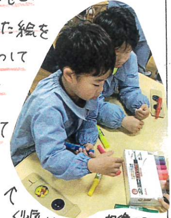
↑ 想像力を働かせて描きました

大学生さんの指導のもと、自分たちで描いた絵を天井や壁・床にうって色々の光の重なりを楽しみました。子どもたちは、うれしくてラタンも瞳もキラキラしてましたよ。