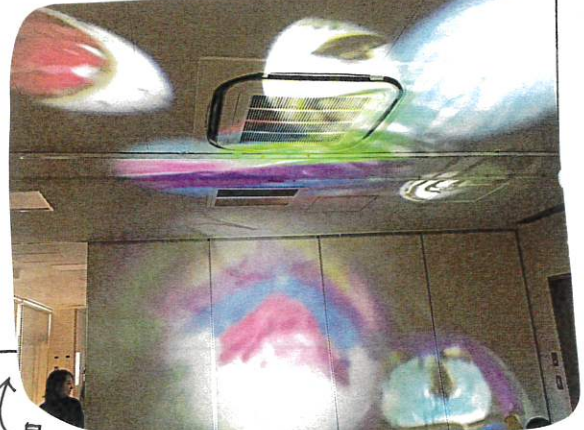
↑ 最後に全員で光らけおとろけたいわゆるのぼり夜空に...