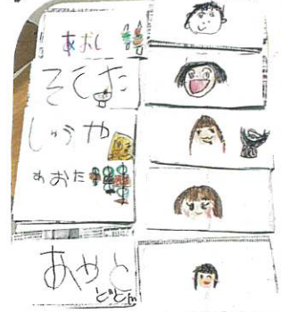
↑ 貝布の形になるとおもしろいよ