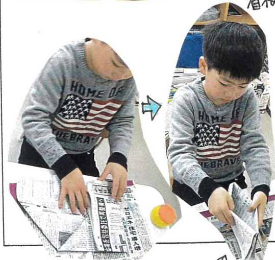
↑ アイロンをいかりかけて