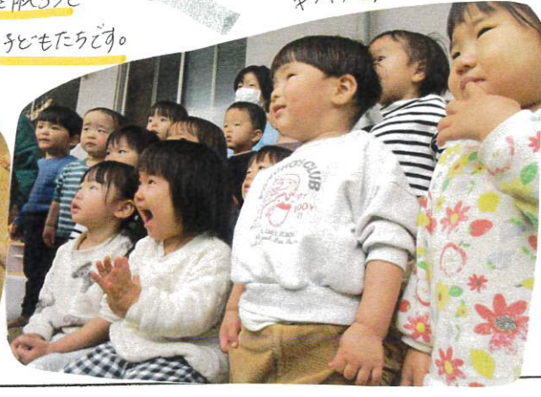
動物園を見よう子ども達の目がキラキラしていました。