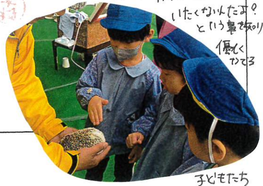
いたかひたあ? という事であら 優く つて