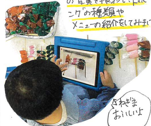
☆おきま おいしいよ

今日はマイ1100トを使って、自分のグループ の写真を撮影し、トピックの種類別や メニューの紹介をしてみました