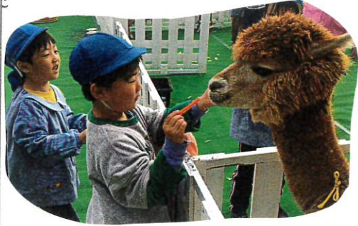
はりやずみは、おこていらい 時にはは育中の毛は

たい。そんな願いをこめてたくさんの動物たち があそびに来てくれました。「あかいかね」 「いしかね」「わかしね」など、子どもたちの 言葉がたまたま聞かれました。