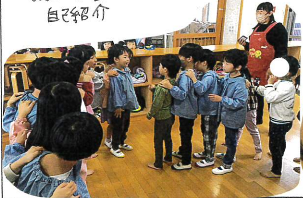
↑ にじ保育園の先生のしゃけん列車 いつもとちがった雰囲気でも楽しめた