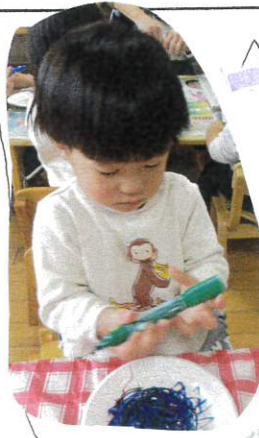
ハコをつかって、なごり描き