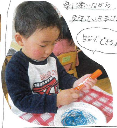
自分でノの気持ちに寄り添いながら見せていきました。