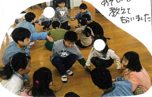
↑ 手を合わせて、息を合わせ ピアノに合わせて立たし、あやたり、みんなと一緒に音が楽しいを共有しました