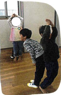
↑ 新しいお合 あそびを 教えて もらいました

少しずつ場がなごんで きました。いつもみんなが 楽しんでいるわらわらたや いしゃけん列車をして 終わるころには笑顔が いっぱい、楽しい時間を 共有しました。