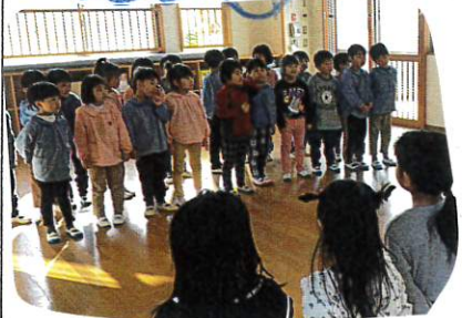
↑ まずは、お互いのクラスで 自己紹介

今日は にじ保育園の年長さん19名が さくら組とあそびに来てくれました。 お互いはいじめて会うので、最初は緊張して ドキドキしていましたが、まず自己紹介の中で 好きな食べ物や、おもしろい おもちゃが出てきたりして、