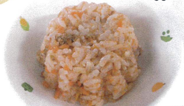
♪ ケチャップライス