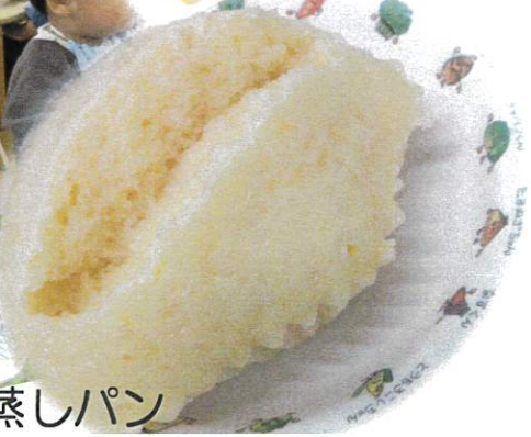
★ オレンジ蒸しパン