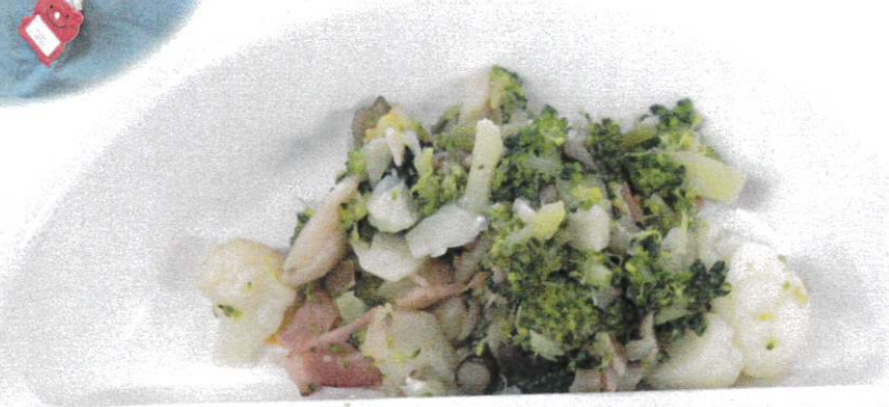
♪ 白身魚のフライ ♪ 花野菜のベーコン炒め ♪ いちご