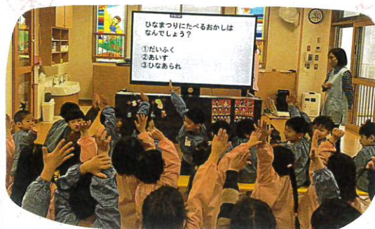
↑ ひなまつりクイズを解く事で、ひなまつりの由来やまめ知識が増えます