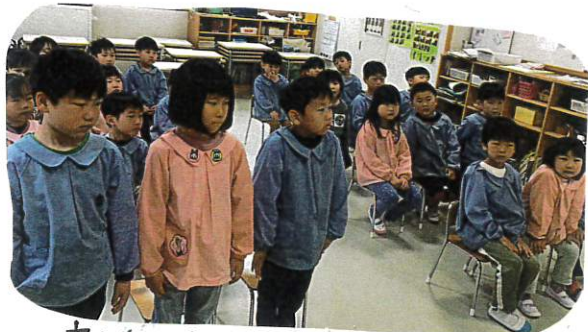
↑ 友だちの動き見て 3人同時に息を合わせて立ったり ↓ 友だちの動きを常にみて タイミングよく動きます 証書のもち方も正しく