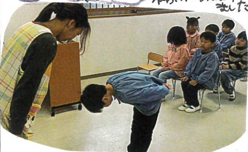
姿勢や視線を意識して

言葉の練習や卒園式の流れを通して練習しました。 本番同様長時間の練習でしたが、姿勢やひとりの動きを堂々と、丁寧に仕事を気持ちよく行っていました。