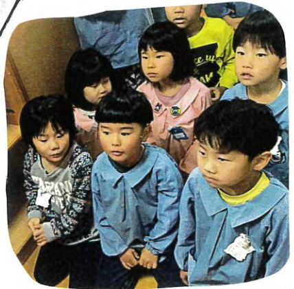
真面目な表情の子もたくさん

日に日にあたたかくなり、もうすぐ春♡ さくら組もひな祭り制作をしました。まず、ひな道をもつてひな飾りに飾られている人形の名前や役割を知りました。 そそいもっている。道具の意味についても考えました