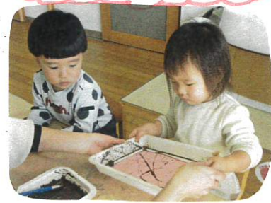
バットを両手で持ち、わかし液をしながらビーズを転がす音が 聞かれました。