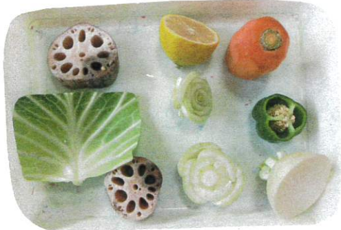
色々な野菜を用意し、子ども達が考え、押し、形になっている様子を見守りました。

スタンプあそびに興味を示していた子ども達。前回は「まる、さくかく、ハート」などの形のスタンプをして、形に興味を示していたので、今日は様々な形の野菜スタンプを準備しました。 「きゅうり、ほうろく」と名前を、上から押し動作を理解し、色づく様子を楽しんでいました。