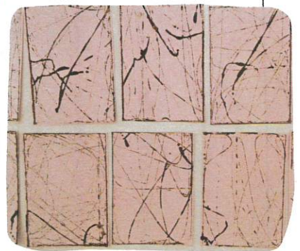
桃の木をイメージしました。