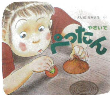
絵本の中には様々な模様の野菜スタンプがたさん

スタンプあそびに興味を示していた子ども達。前回は「まる、さくかく、ハート」などの形のスタンプをして、形に興味を示していたので、今日は様々な形の野菜スタンプを準備しました。 「きゅうり、ほうろく」と名前を、上から押し動作を理解し、色づく様子を楽しんでいました。