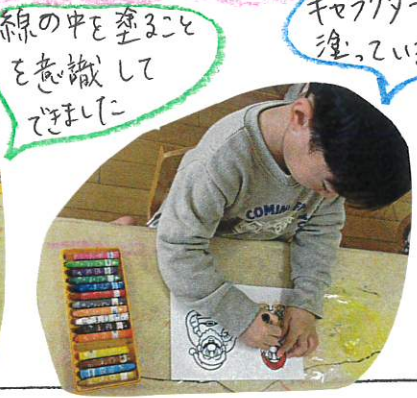
線の中を塗ること を意識して できました