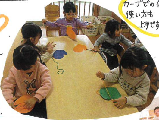
カーブでの体の使い方も上手です。

てぶくろの穴に毛糸を通しました。セモ通しも大好きで、コーナーあそびの時にモよくしています。どんな「てぶくろ」が完成するのが楽しみです☆