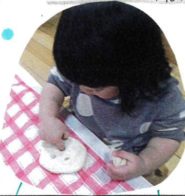
ツツツン... 指のあとを 楽しんでいま