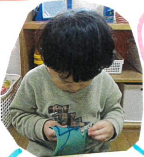
「こんにちは」と言いながら穴に毛糸を通してました。