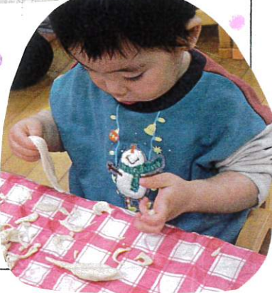
細かくちぎってほろ。 指先をよく使ってますよ