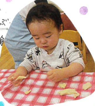
ちぎったり、長く伸ばして ねん土を持ち上げたり。 長い時間、仮に座って 遊んでいました♡