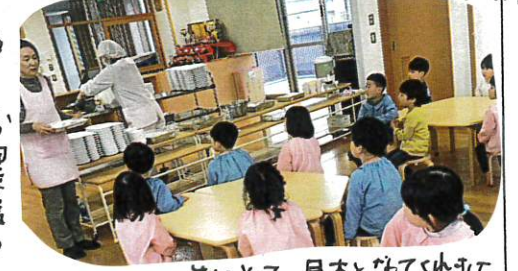
さくら組が先にして、見本とみてくれました。