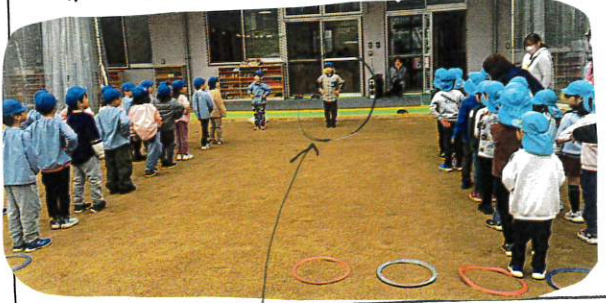
かによく、大きな音で「見本とみてくれました」