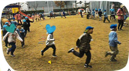
↑ 体操の後はマラソン。1曲の間長かたてすが走り切りました。

今日は近くの保育園の子どもたちがあそびに来てくれました。もしいたら小学校で同じクラスになるかも知れないと聞くと、「え」とおどろきの様子でした。