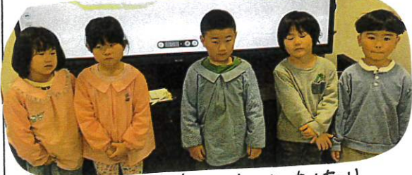
↑ まさは、クラス代表で、あいさつをしたり、前で足踏、てくゆる人を決めました。