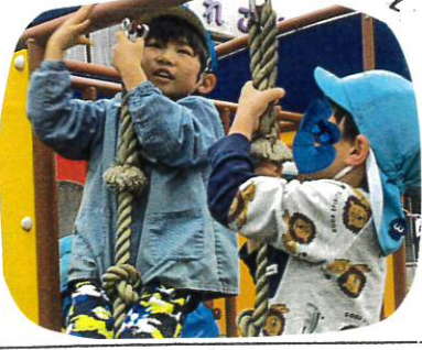
← 勇気を出して友だちに話しかける姿も、「どの小学校」ときいていましたよ。