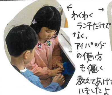
← わかく ランチだけなく、アヒルの使い方も優しく教えてあげていましたよ。