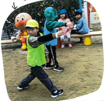
↑ なにクラスでみんな協力して2回ともさくら組の勝ち手でした。