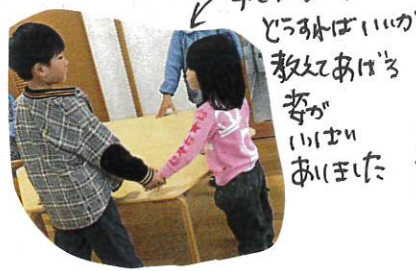
← 手をのびて、どうすればいいか教えてあげると、姿勢もよくなりました。

今日は、はら組さんがホールで初めて、いきなりの本園食生活にお約束をしっかりと守って、はら組さんに見本となって教えてあげました。