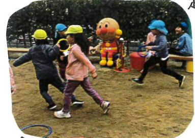
↑ 次はクラスを交代してリレーもしました。