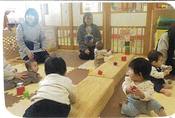
今日もたくさんのお友だちが来てくれました!! ありがとうございます♡

今日は、園庭開放もあり、たくさんのお友だちが遊びに来てくれました。演奏会後、戸外あそびと室内あそびに分かれて休んだり、ふれあいました!! 室内では、エッグマラカスを上手に持ち、音を鳴らして楽しみました!! また、来月も遊びに来てね♡