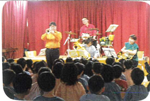
あおぞら金管合奏団のみなさん