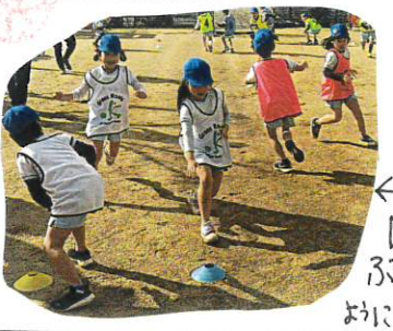
自分のチーム の色にタオル 周りを見て ぶつかると よいです

おめでとうありがとうございます!!! 保護者の方と楽しくプレーする事ができ 子どもたちも以上に楽しくプレーしていました? チャンピオン!! イェー!!!