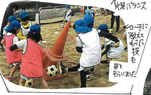
パススヤ コーナーに 蹴りこむ 技も 見 ました