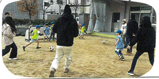
子どもたちも白熱した 試合になりました。