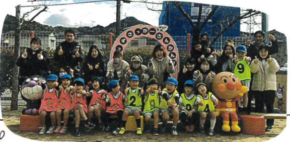
どのチームもよくがんばりました!