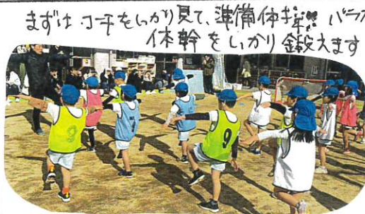
まずはコートをいかり見て、準備体操、パススヤ 一本幹をいかり金銭大ます