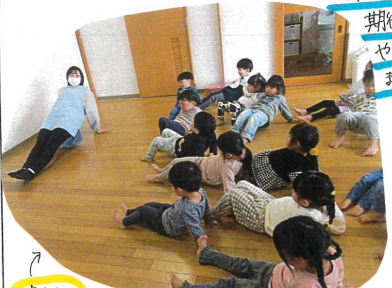
おわり台 足を伸ばし、お尻を浮かせて可也

いつも行くリズムあそびをレベルUPさせて 今日はバランスあそびにチャレンジです☆ 幼児クラスに向けて 期待感を持って やっています まい。