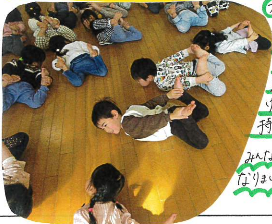
カ× うつぶせに なり 足を曲 げて手 持ち可也! みんは上手に なりまにね!