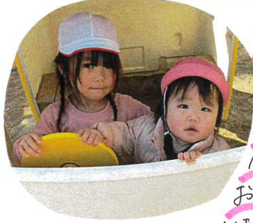
春の心地良い天候の もと姉妹はあそびを見つけてゆりぐみです!