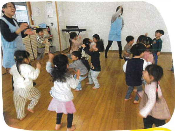
エビカニクスの体操をします。 皆リリリで楽しみましたよ