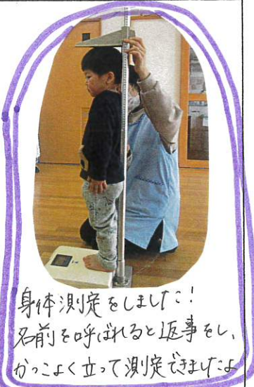
身体測定をします! 名前を呼ばれると返事をし、 かっこよく立って測定できました