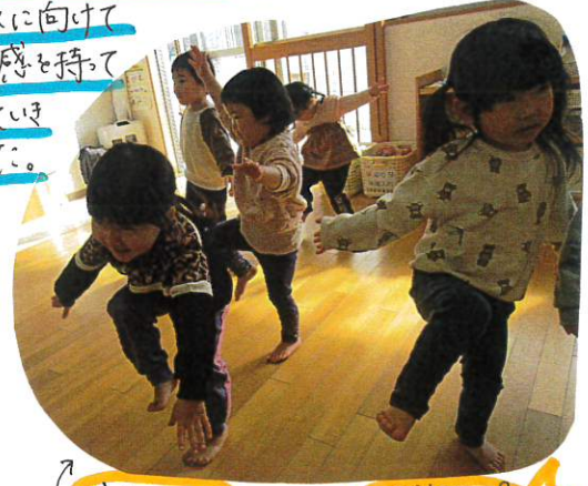
片足バランス おとととと〜 10秒キープ 頑張っている