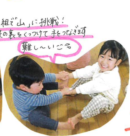
2人組ぞうに挑戦! 足の裏をくっつけて手をつなげて可也 難し〜いころ