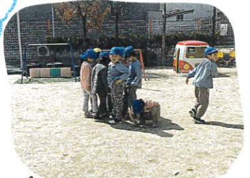
↑おに ↓きんぎょでポーズ ↑友だち同い ↓きんぎょで集まって ↑おに ↓きんぎょでポーズ ↑友だち同い ↓きんぎょで集まって