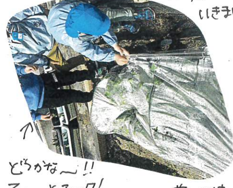
↑ ↓ どうかな～!! そっぴアワ! あ、ビニールの中はあたたかい!!