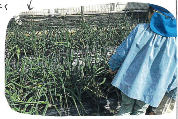
↓ ↑ ↓

↑みんなの卒園式に華をそえるチューリップも等が出てきました。玉ねぎも、こんなに大きくなりました