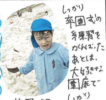
北風こにあそびました