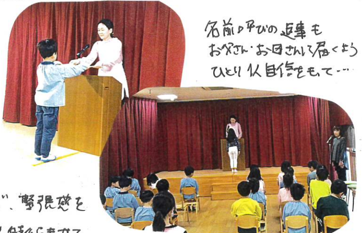
名前呼ぶの返事も お父さん・お母さんへ届くように ひとり自信をもって...

今日は、あと9日後の本番に向け、子行練習を行いました。園長先生にも参加してもらい、本番同様の進行で、緊張感を掴みながらも、期待に胸を膨らませている子どもたち。カッコいい姿を見てもらいたいという思いで練習にも力が入っていました。