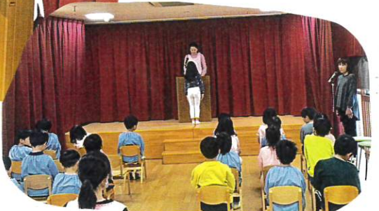
来てもらっている方に正しい姿勢で 入場に向けて物事への取り組み方を 伝えます