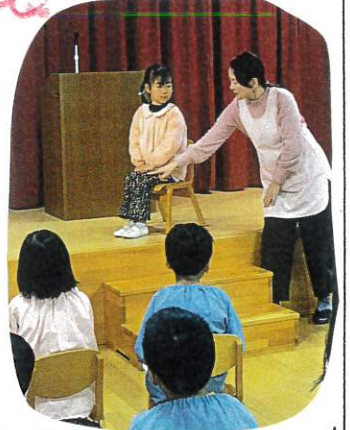
一人ひとりが、終ったあと、がんばった事や がんばりに関する事を話し、お褒めを 最後まで偉いことがんばる事に おいました