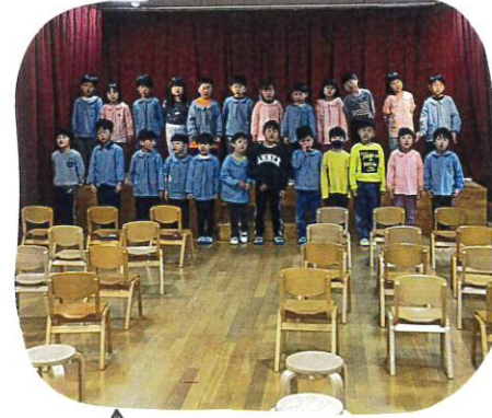
↑ 思いをこめて、みんなで作って うたいました