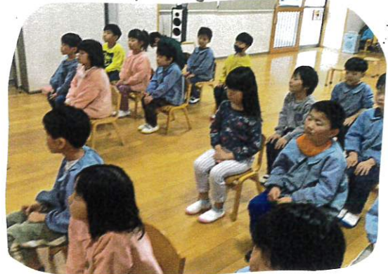
入場から、横断幕の戻り方を必めて 一休整をとり、とくみします