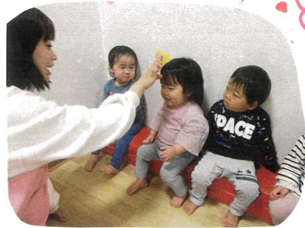
♪ 頭の上にとまらふこ ♪