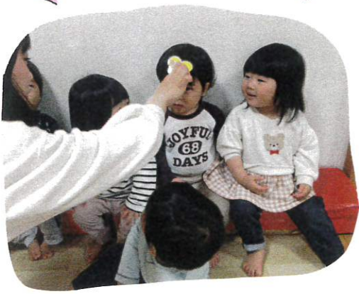
ちゅーりっぷ ~ 🍌 ひらひら