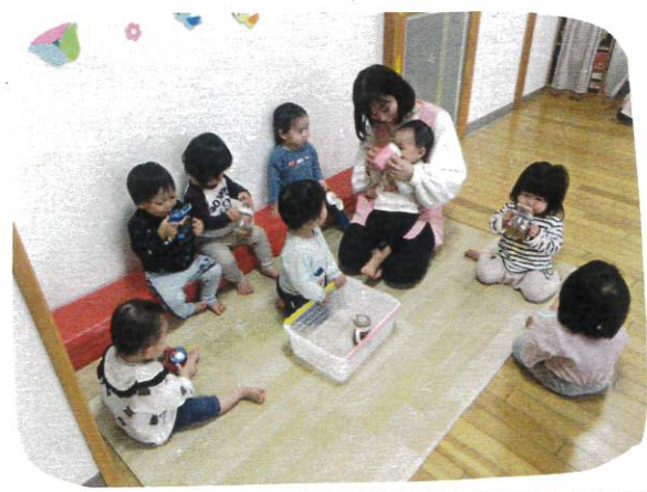
自分でマグの取っ手を持ち飲んでいます

しっかり体を動かした あとは、お茶休憩を しましたよ。みんなグクグク!! お茶を飲むと気持ちも少し セリ整わり、涙が止まる子の 姿もみられました。