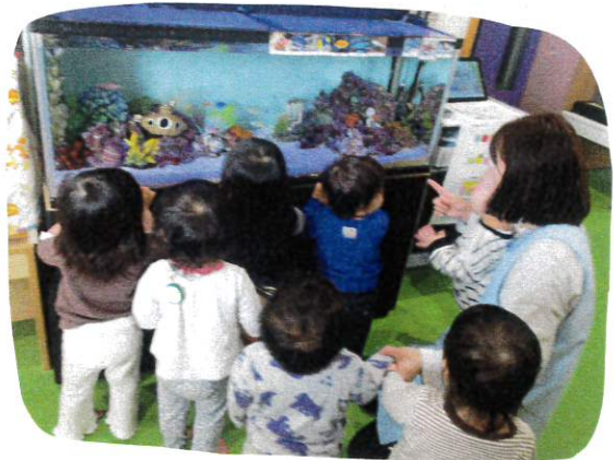
／ たいたい、／ あた!!

新しい環境に慣れ、 きている子ども達 保育教諭が抱っこすると 安心し表情を見せてくれる ようにもなりました。