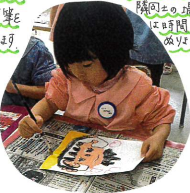
(こぼさないよう) 隣同士の場合 は時間差で ぬります。