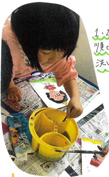
1.2.3の 順に筆を 洗います。