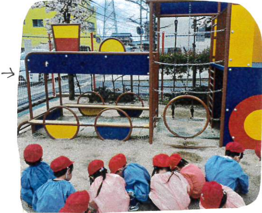
大型遊具の使い方や危険について

新しく使える 大きい、3人乗車 3台 や 2人乗り自転車 2台 は、やはり合せて使おうかと確認しました