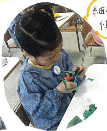
糸田のから 小真重に...