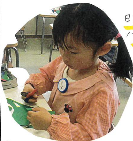
毎日作る。ちゅーりっぷの葉と茎を ハサミで切っていくまじよ!!