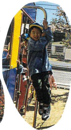
安全に遊ぶ ための決まりを 守りながら、 楽しみましたよ!!