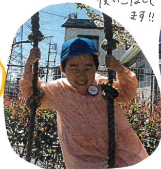
さすが年長マン!! 大型遊具も 使いこなして ます!!