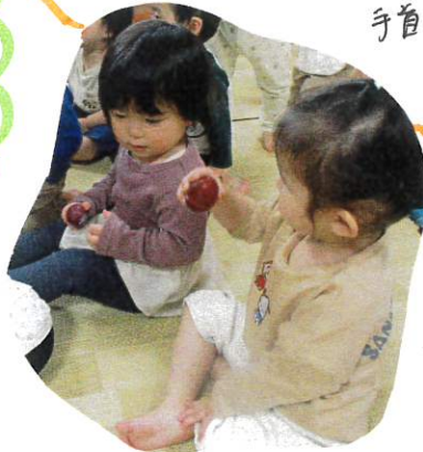
手首を叩く動作にもつながります♡

色々なシェイカーに子ども達は興味津々です!! 握りやすい形にしたエッグシェイカー!! 感覚の刺激や、