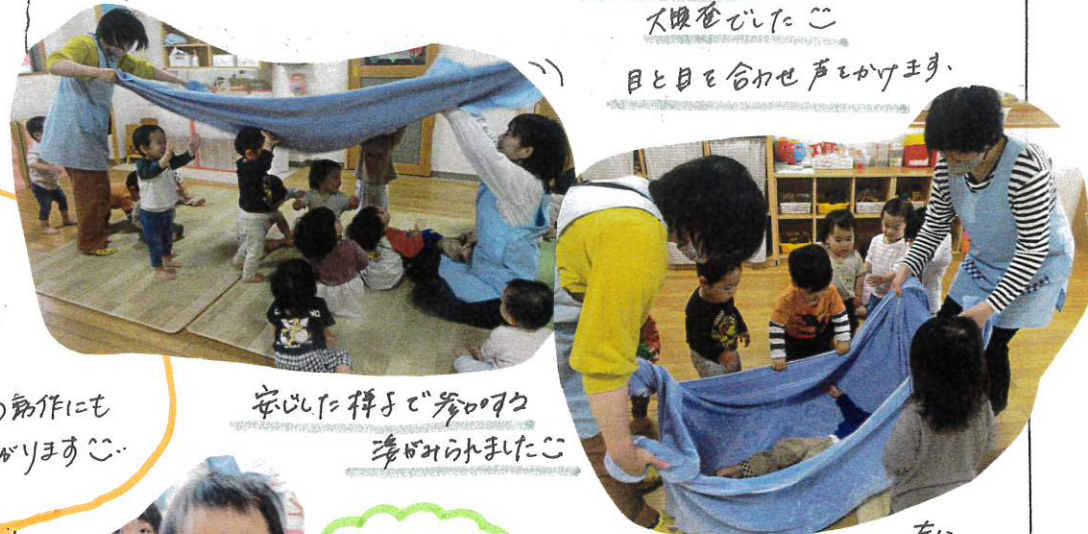
安心の様子で参ります 準備ができました!!

うたに合わせて、大きな布を叩いて風を起こしました!! 風に吹かれて子ども達は大興奮でした!! 目と目を合わせ声かけます。