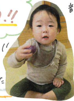
シカシカ 音が鳴る

季節のうたや、おもちゃの知れ知れ曲の曲に合わせて、エッグシェイカー(エッグシェイカー)を振り回し、手ごたえを感じて音を鳴らすことを楽しみました。