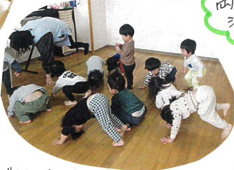
「ごりらのうごき」 ごりらの木身あそびがどれも上手♡ 月几をうっぴりぽとたたきます。