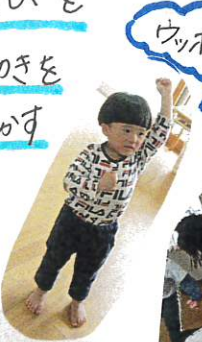
「ろばのうごき」 片足をホーンと蹴り 上げます!!