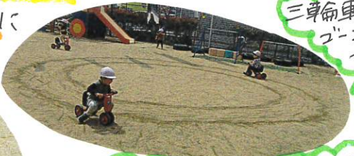
三輪車にのり ゴーン ゴーン