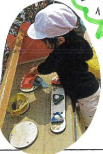
キッチンで ごちそう 作り♡