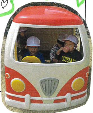
今日も人気の マリアンバスのミ