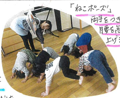
「ねこポーズ」 両手をつき、 月几を高く 上げます♡

子ども達の大好きな絵本、 「エwokカールのできるかな？」の 絵本の音楽に合わせて、色々な 動物の動きを模倣あそびをし ました。保育者や先生の動きを 見ながら、しっかり身体を動かす 子ども達です♡