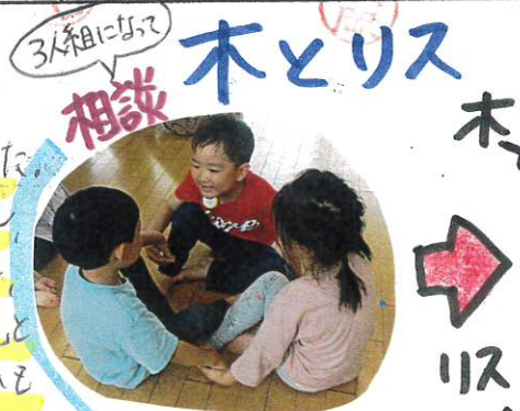
3人組に 相談 木とリス