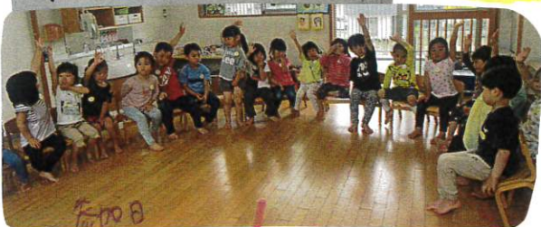
参加日 保 たのしかった人〜? / は〜い!!

金曜日は、お忙しい中、ありがとうございました。 ひまわり組になって初めての参加日を体験し じゆうだったか、朝の会の時に皆に聞いてみると 左記のよりの意見が出ました。特に「楽しかった」と いう意見が一番多く、緊張も取れいらいよ あによりです。色々な感情を抱きながら またこの成長した事と思います。