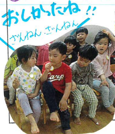
おしゃたね!! さっかん、さっかん

「仮取りゲーム」やりたい!! という事が多く上がったので、今日も勝負!! 負けてくやい!! 勝て 嬉しい!! という気持ち を経験しながら、 皆であそぶ楽しさを 感じているよりでした!!