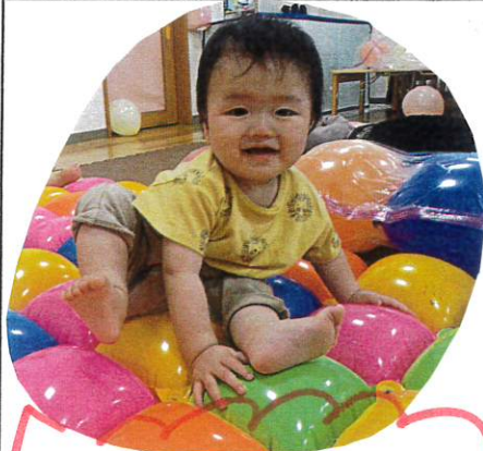
風船 マットの 上 に すわって うれしそうに アーウ!!