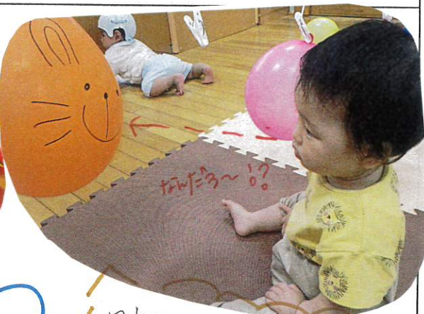
風船に うさぎの かおを かきとって たわぶる~!! と きいている Oちゅ