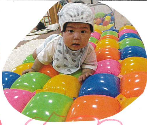
風船 マットの 上 を ハイハイで すわっている Memob