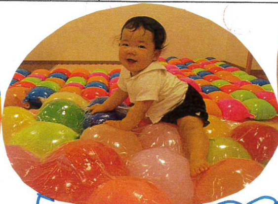
風船 または 圧縮風船の上を ハイハイで すわって つかっている Aちゅ!