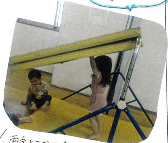
両手をつかって持ち上げて進んでいたNちゃん