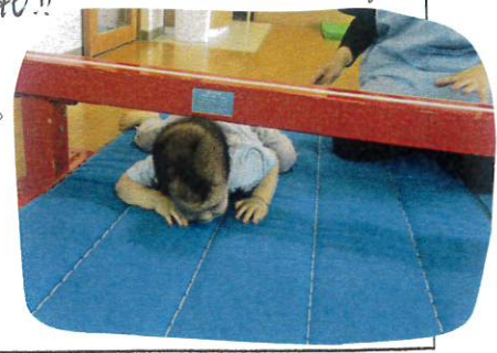
頭があたらははは!! そとそと...