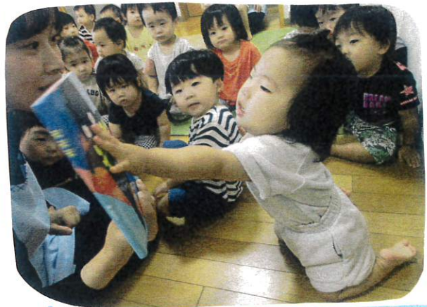
お名前呼びでは、「どぞぞ」の絵本にタッチ!!

主な活動 9:15 排泄 9:40 片づけ 9:50 運動あそび (マットの壁押し、平均台くぐり) 10:40 排泄 11:20 給食