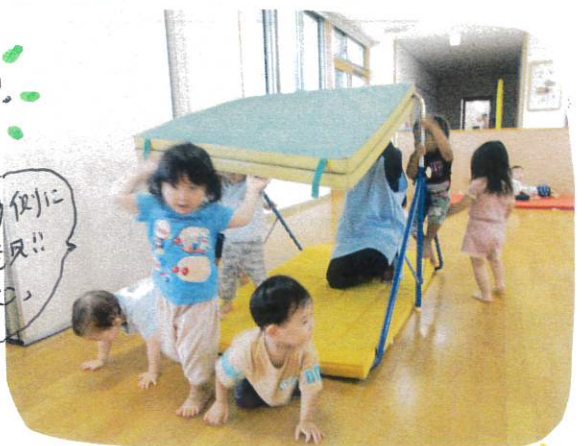
立て前進する子、はいはいで前進する子、排泄の仕方は子ども達それぞれです。「おはよう」とする姿もたくさん見られました。