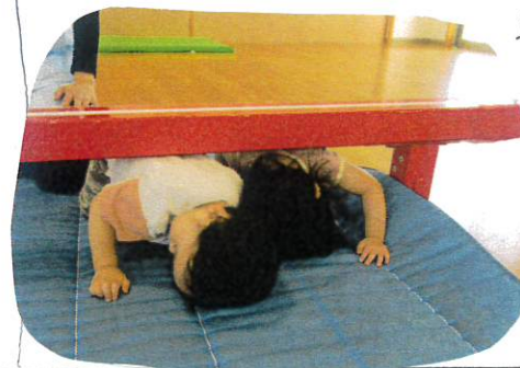
平均台をくぐるこいの挑戦!! くぐるようになる子の姿も見え、気づきがありました。頭をうつろいように腕をつかいて前進していましたよ!!