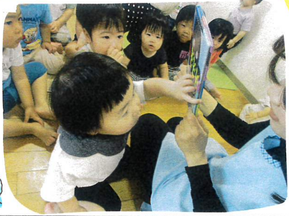
せんせ早く読んでよ!!

「どぞぞ」と言うときも子ども達も保育教諭の模倣をくり返し単語を言おうとする姿がみられます。