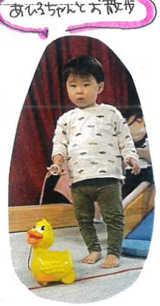
あそび椅子でお散歩