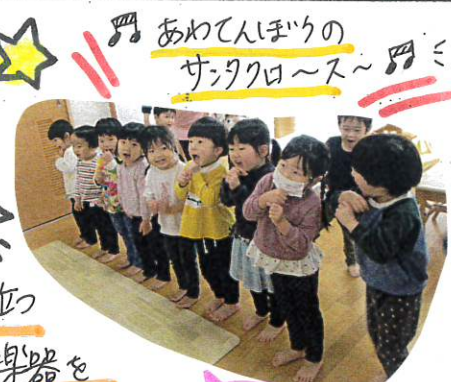
あわてんぼうのサンタクロース～

今朝のかわいい姿をご紹介～ あわてんぼうのサンタクロースの曲が聴くと、前に並び ちび先生たち (はきかて元気いはい歌う姿に、楽器を 持て歌ってみよう!!) となり、すずを持て楽しく歌うゆりみでしたよ