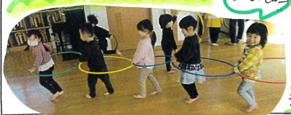
お友達と歩幅を合わせて 汽車ポッポ～