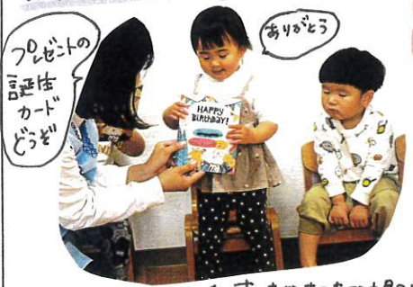
プレゼントの誕生日カードを渡す。ありがとう。

保育教諭からのプレゼントは、すてきなすてきなゆり子さんパネルシアター。キーの登場にうらやま!! 4人で35秒の火をフー!!