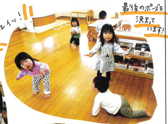
最後のポーズを決めます!

保育教諭の重くさを見ながらまねたり、おぼえている重くさをしっかり表現していました。