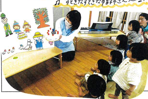
♪ すてきなすてきなゆり子さん〜♪