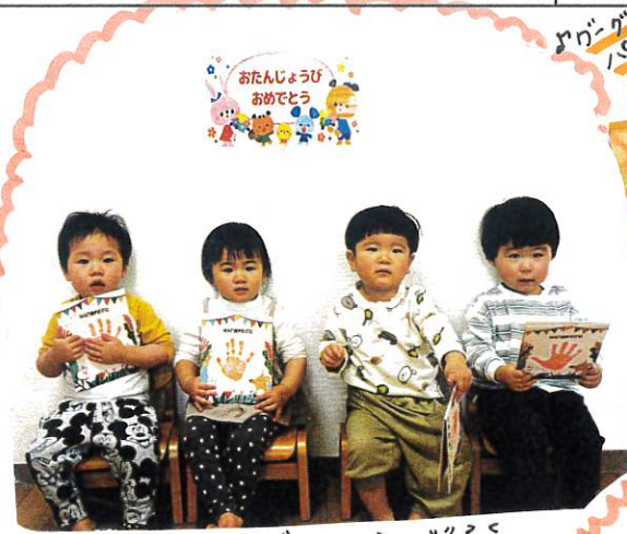
バスデーカードを持って「ハッピーバースデー」の歌をうたう。2さいのお誕生日おめでとう!!

4月生まれ4人のお友だちのお誕生日会がありました。名前を口呼びされると堂々と前のイスに立ち、みんなにお祝いしてもらい嬉しそうでした!!