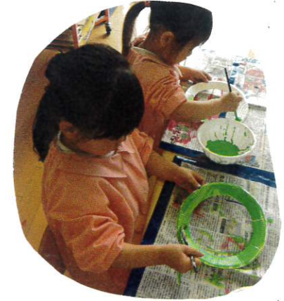
筆の使い方も、よく聞いて、真似することができていました!!