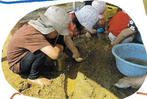
友だちが川を作っていると興味を 持って一緒にやること姿も見られて います。