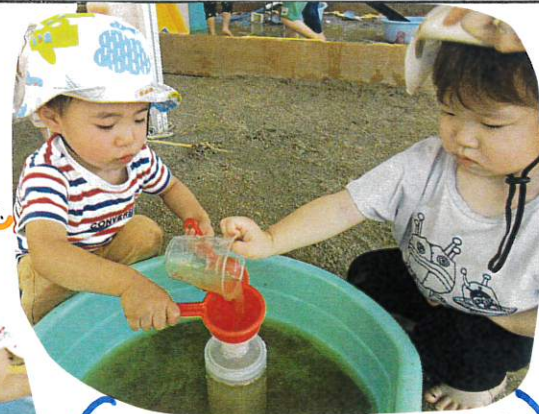
じょうごを使って2人で協力して ボトルに水を入れていきます