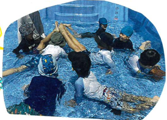
2人組の トンネルくぐり

バランスの山と2人組で作り出す。その下をくぐるのが 顔と少し水につけないと通れない トンネル役の友だちに励まされながら チャレンジする姿が沢山見られました!!