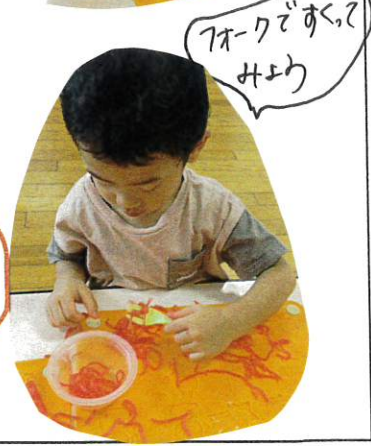
7分ですくすく 上手