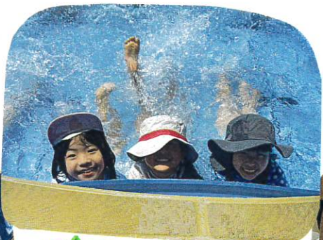
水しぶきもへっちゃら!!

水に慣れてきて、バタ足で 顔に水がかかるのもへっちゃら!! バタ足競争が始まるほどです!!